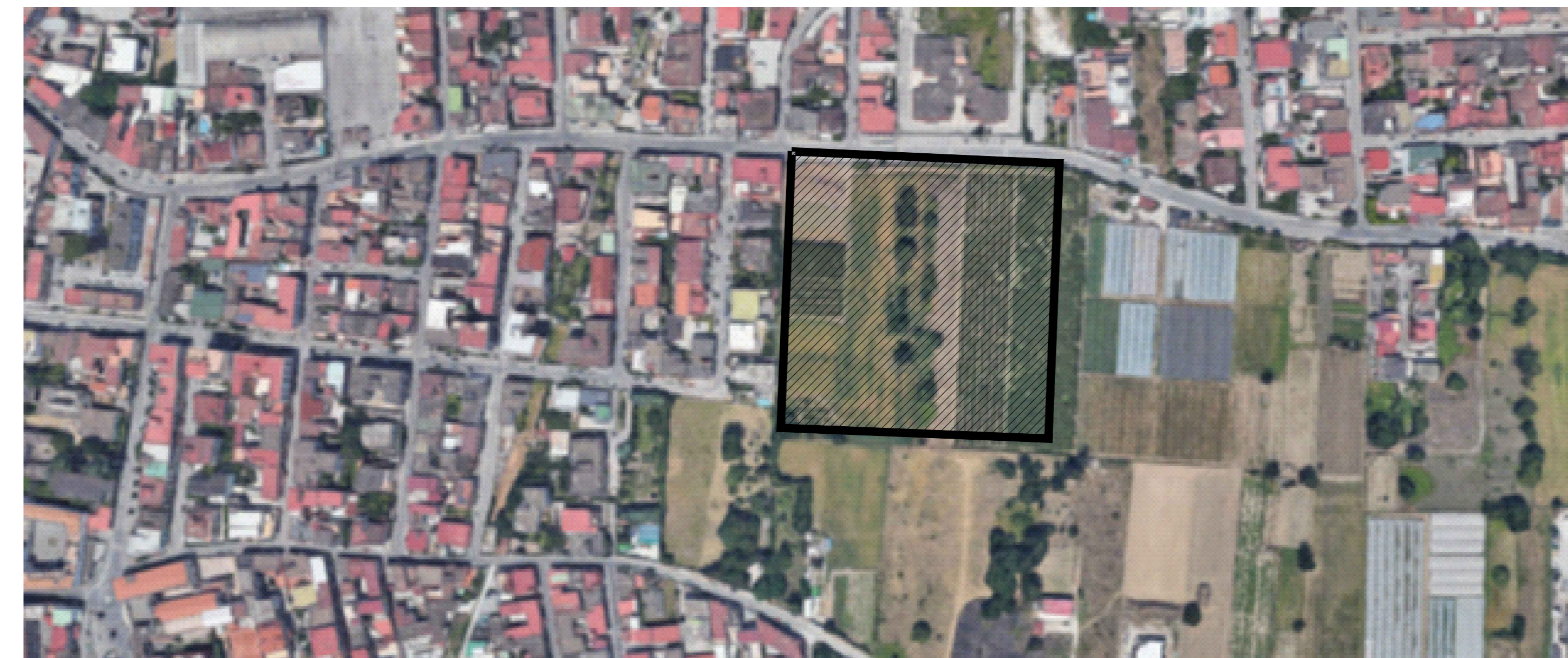
COROGRAFIA DI DETTAGLIO