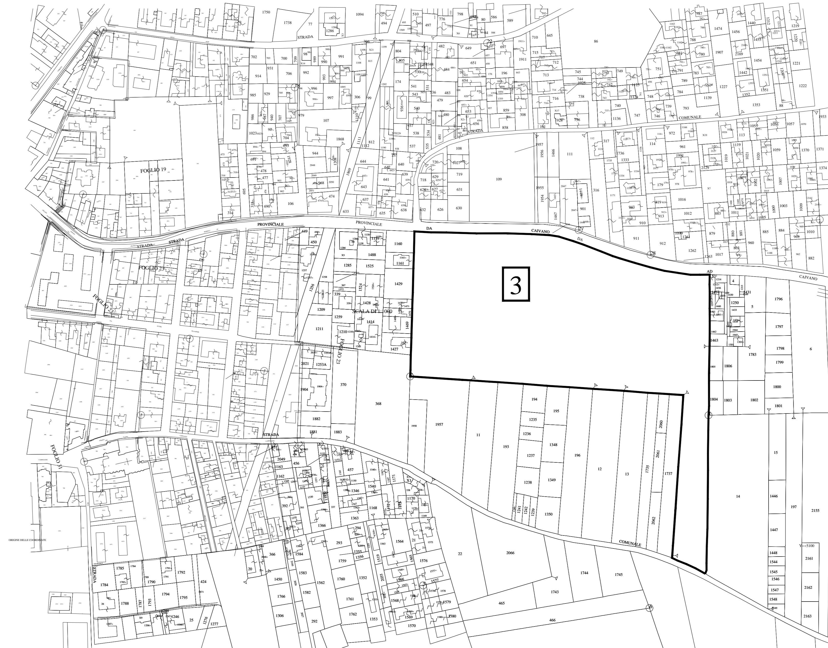
STRALCIO CATASTALE FOGLIO 23 PARTICELLA 3 la part. 3 ricade in parte in zona E2, in parte in zona C1, in parte in zona G e in parte in zona F2 (si veda il certificato di destinazione urbanistica rilasciato dal Comune in data 27.10.22 che si allega alla relazione tecnico descrittiva)