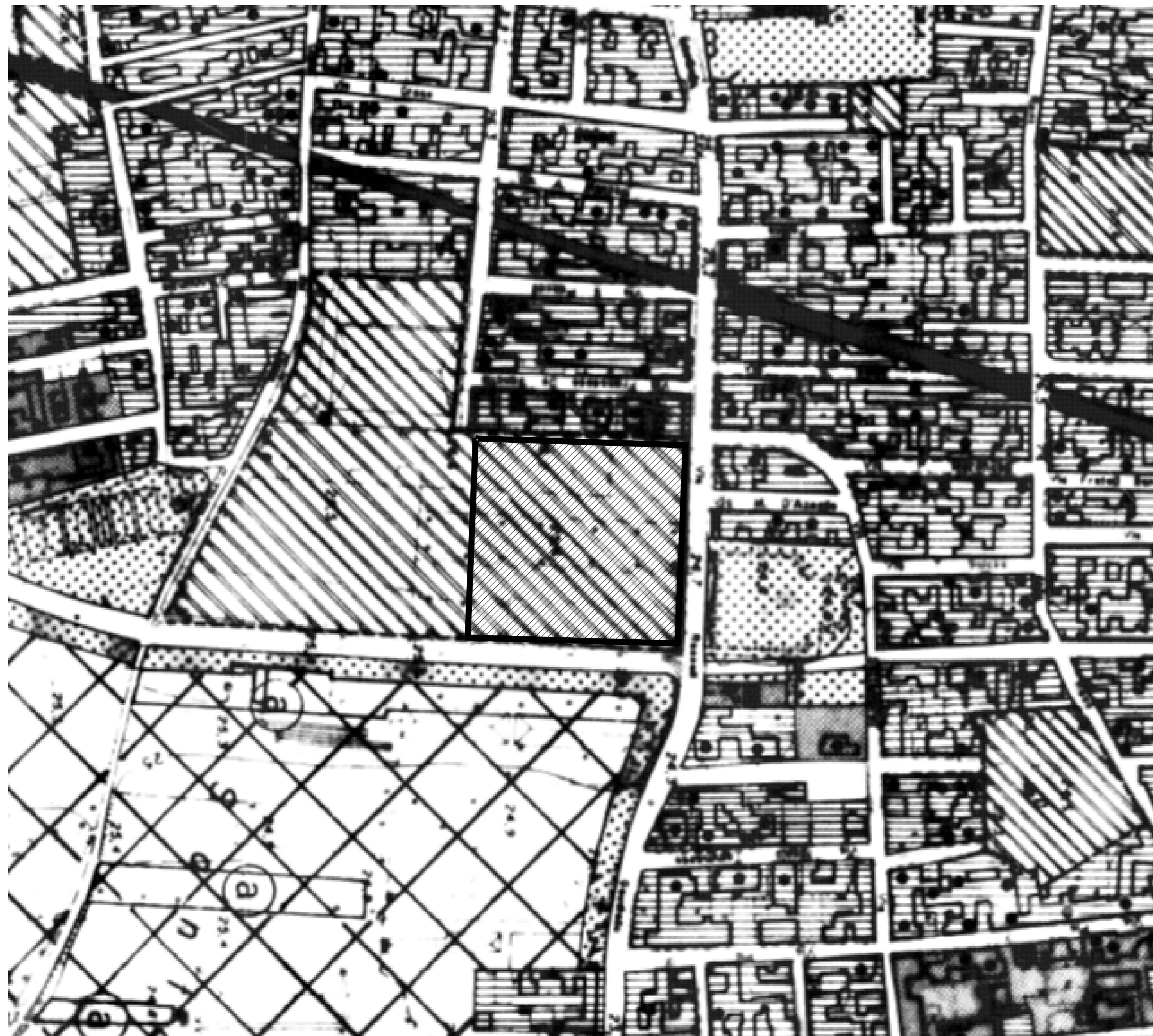
STRALCIO PRG (zona omogenea C1)